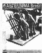
Capa: Geringonça , (detalhe) de Manoel Molina

Estamos de volta com o Boletim Informativo da ABTB/UNIMA Brasil e com ele anunciamos a volta, depois de quase dez anos, da Revista Mamulengo e notícias fresquinhas sobre o encontro Panorama do Teatro de Bonecos no Mercosul - Propostas de Intercâmbio , além de informações sobre o que está acontecendo no movimento bonequeiro no Brasil. Depois de uma longa ausência devido a dificuldades operacionais, o Boletim Informativo volta com a intenção de manter uma periodicidade mensal, e para isto contamos com o envio de notícias e colaborações de todos os associados. As notícias aqui veiculadas também serão disponibilizadas na Internet aumentando assim o alcance da divulgação da arte do boneco no Brasil, em breve teremos na "Home Page" da ABTB/UNIMA Brasil versões em Inglês e Espanhol. Aproveitem e participem, o Informativo é nosso.