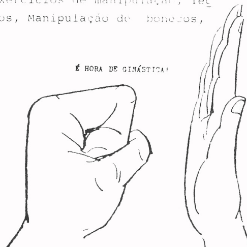
"TESTE DE COMPREENSÃO E EXTENSÃO DAS MÃOS"

Os Exercícios que mostram as fotos ajudam a dar mobilidade as mãos e auxiliam o manipulador quando for utilizar os bonecos de luva.